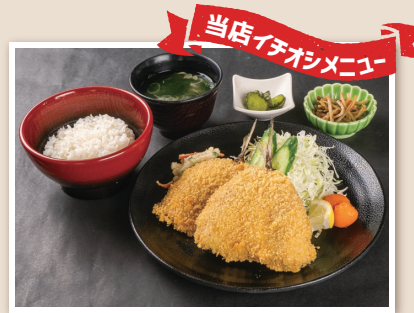
あじフライ定食 Horse mackerel fry