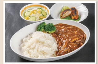
ハッシュド・きのこ Hashed mushrooms