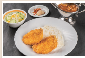
チキンカツカレー Chicken cutlet curry