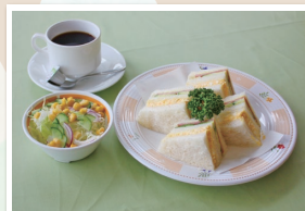
ミックスサンドウィッチセット mixed Sandwich set