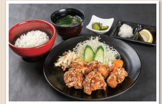
鶏の竜田揚げ Fried chicken set menu